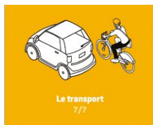
Le transport 7/7

Thématiques abordées : le transport, le matériel informatique et électronique, l'utilisation du numérique, les consommables (papier, piles...) et l'alimentation.