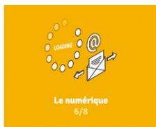
Le numérique 6/8