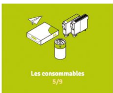
Les consommables 5/9