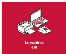
Le matériel 4/6